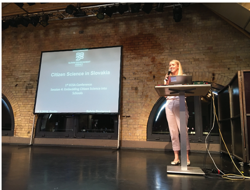
Obrázok 4 Prezentácia úspešných projektov Citizen Science