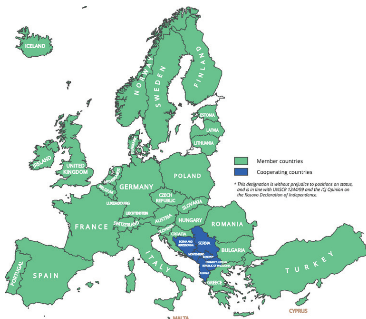
Obrázok 1 Členské a spolupracujúce krajiny EEA

a Tureckom. Spolupracujúcimi krajinami je šesť krajín západného Balkánu: Albánsko, Bosna a Hercegovina, bývalá juhoslovanská republika Macedónsko, Čierna Hora, Srbsko a Kosovo, podľa rezolúcie Bezpečnostnej rady OSN č. 1244/99. Tieto aktivity spolupráce sú začlenené do siete Eionet (Európska informačná a monitorovacia sieť) a Európska únia ich podporuje v rámci nástroja predstupovej pomoci. EEA sa zapája do rozsiahlejšej medzinárodnej spolupráce, ktorá siaha za hranice jej členských štátov. (obr. 1)