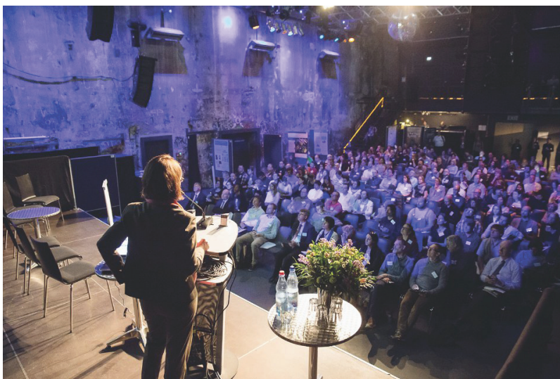
Obrázok 3 ECSA Konferencia, Kulturbrauerei, Berlín

SAŽP je členom záujmových skupín IG Citizen Science, IG West Balkans a IG Green Economy, ktoré fungujú pri EPA network. V rámci IG Citizen Science sa uskutočnila 1. ECSA konferencia v Berlíne, Nemecku.